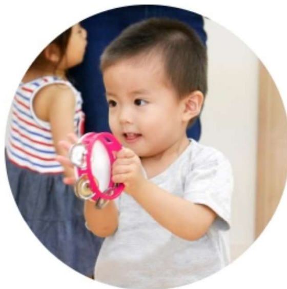
教室レッスン 先生と対面で