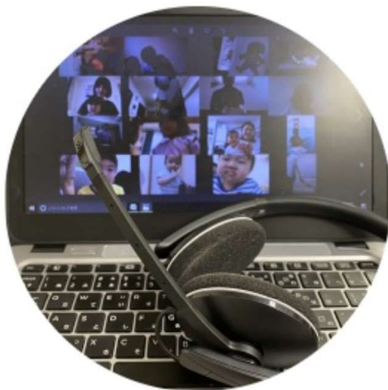
Zoomレッスン おうちから参加